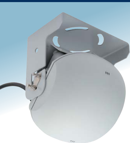
INFOBEACON II 外観